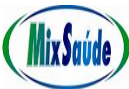
image001.jpg 6 KB

A C MATERIAIS MÉDICOS LTDA - ME CNPJ 11.138.620/0001-08 – I.E 90494458-03 Fone/Fax: (44) 3029-6988