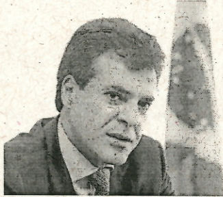
"Vamos interiorizar o governo e levar ao conhecimento aquilo que o Estado está fazendo", Richa

A equipe do governo apresenta aos gestores municipais os projetos e programas de cada área do Estado, aproximando o governo das adminis-