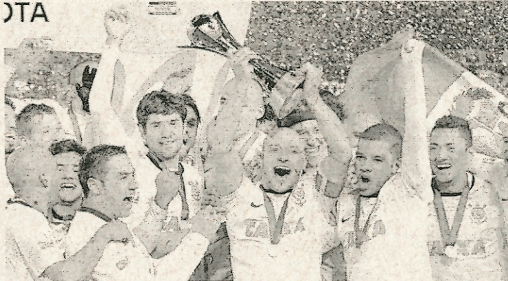
Imagens de grandes conquistas do Corinthians foram postadas ontem, 1º, para comemorar o aniversário do time

já arrecadou R$ 18.952.949,20 e levou 296.346 torcedores pagantes ao estádio.