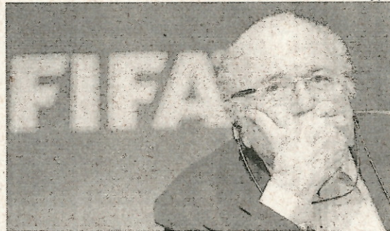
Joseph Blatter, presidente da Fifa: medida dura para afastar empresários e fundos de investimento dos negócios do futebol

Na Europa, um dos maiores empresários do futebol, dono do passe de jogadores valorizados, é o português Jorge Mendes. A imprensa inglesa o acusa de usar empresas em paraísos fiscais para comprar jogadores. A transação mais recente envolvendo Mendes foi a transferência do argentino Di Maria, que deixou o Real Madrid e assinou com o Manchester United. O atacante Diego Costa, que também nesta temporada trocou o Atlético de Madrid pelo Chelsea, é outro cujos direitos econômicos têm o carimbo de Jorge Mendes.