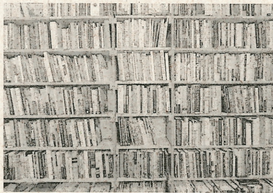
Estante Virtual: atualmente portal é o terceiro maior vendedor de livros do Brasil.