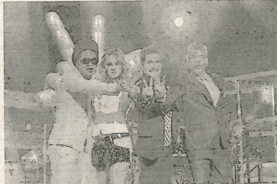
Carlinhos Brown, Daniel, Lulu Santos e Claudia Leite: os técnicos do 'The Voice Brasil'