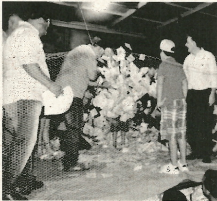
40 mil nas premiações.

Durante a noite serão sorteados: "1 Tv 32 polegadas", "1 notebook", "4 tablets", "4 Smartphones" e "Um Fiat Pálio 0km". A promoção "Natal Luz" tem o investimento de mais de R$