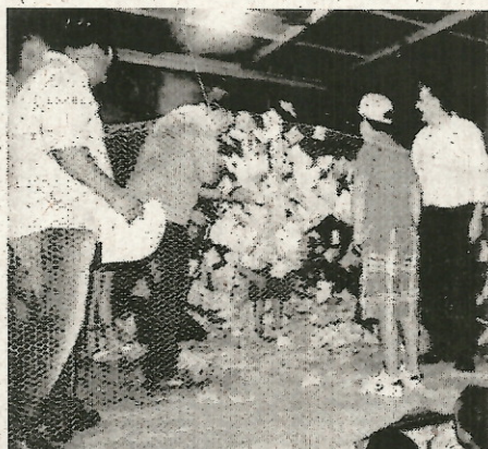
40 mil nas premiações.

Durante a noite serão sorteados: "1 Tv 32 polegadas", "1 notebook", "4 tablets", "4 Smartphones" e "Um Fiat Pálio 0km". A promoção "Natal Luz" tem o investimento de mais de R$