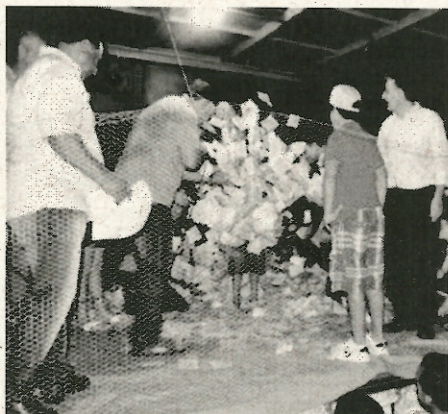
40 mil nas premiações.

Durante a noite serão sorteados: "1 Tv 32 polegadas", "1 notebook", "4 tablets", "4 Smartphones" e "Um Fiat Pálio 0km". A promoção "Natal Luz" tem o investimento de mais de R$